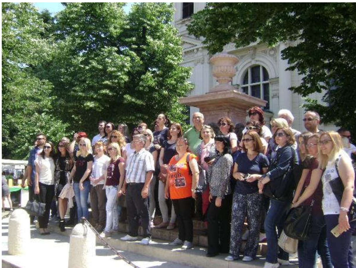
Наставници ОШ „Миле Дубљевић” испред чесме у Сремским Карловцима

Ђачке екскурзије одржане су по плану, маја месеца ове године. Од 1. до 7. разреда спроведене су једнодневне екскурзије, док је екскурзија за 8. разред, на Ђердап, трајала два дана. Рекреативна настава од 1. до 4. разреда одржана је током марта месеца у Соко бањи. Синдикат школе организовао је и излет за наставнике и раднике школе у Сремске Карловце и Нови Сад.